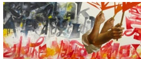
11 КОВАЛЬ ЮРІЙ (1979) ГОРОБІЙОВ ЗАКЕНТІЙ (1984) «Заблукати не сором, сором іти хибним шляхом», 2021

полотно, олія, аерозольна фарба, акрил 41 x 98 см Підпис і дата на звороті