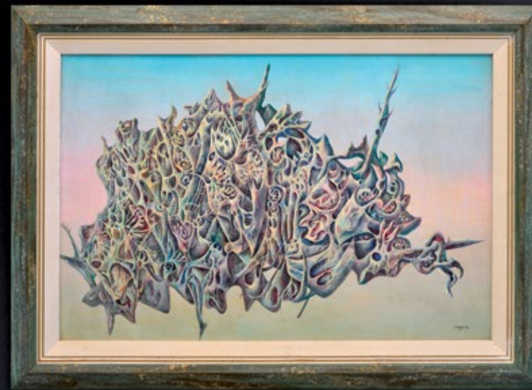
Іван Марчук. «Планета на орбіті» (1974)