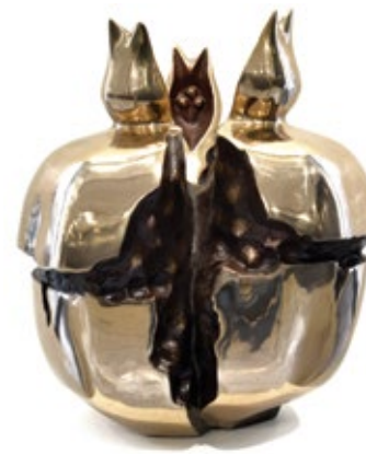
17 ЛИПОВКА ВІКТОР (1956) «Стиглий гранат», 2021

бронза h – 49 см Підпис, дата і тираж на скульптурі Тираж: 3/9