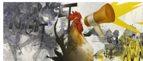
10 КОВАЛЬ ЮРІЙ (1979) ГОРОБІЙОВ ЗАКЕНТІЙ (1984) «Найтемніша ніч перед світанком», 2020

полотно, олія, аерозольна фарба, акрил 41 x 98 см Підпис і дата на звороті