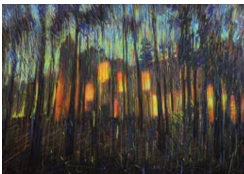
9 НАУМЕНКО АЛЬОНА (1981) «Крізь сосни», 2021

папір, кольорові олівці, фломајстер, акрил 72 x 102 см Підпис і дата на звороті