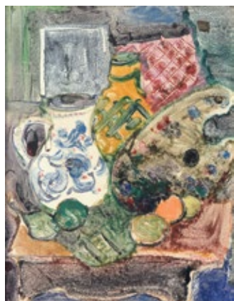
3 ГЛУЩЕНКО МИКОЛА (1901–1977) «Натюрморт» (Nature morte), 1967

папір, монотипія 55 x 44 см Підпис і дата знизу праворуч