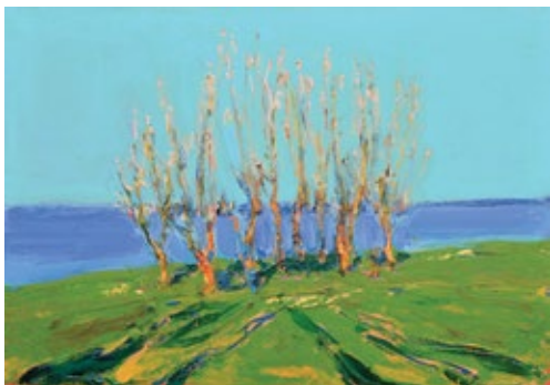
7 КРИВОЛАП АНАТОЛІЙ (1946) «Абрикоси зацвітають», 2011

полотно, олія 70 x 100 см Підпис і дата на звороті