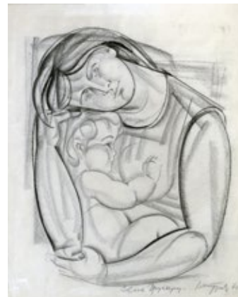
4 ТУРОВСЬКИЙ МИХАЙЛО (1933) «Мати», 1970

папір, олівець 56 x 49 см Підпис і дата знизу праворуч