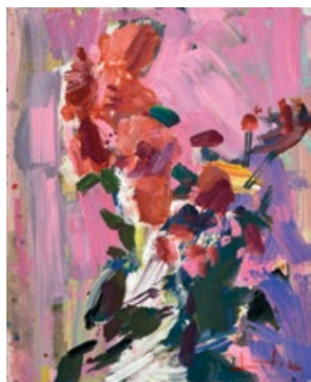
8 БАБАК ОЛЕКСАНДР (1957) «Троянди», 2022

полотно, акрил 100 x 80 см Підпис знизу праворуч