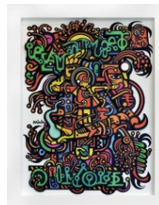
12 МІНІН РОМАН (1981) «New May Challenge», 2020

пенокартон, УФ друк, барельєф, авторська техніка 76 x 60 см Підпис у центрі праворуч Тираж: 4/10