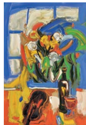
6 ДЕМЦЮ МИХАЙЛО (1953) «Натюрморт зі скрипкою», 2000

полотно, олія 100 x 70 см Підпис знизу праворуч