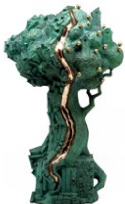
14 МИКИТЕНКО ВОЛОДИМИР (1970) «Дерево життя», 2022

Бронза, патина, позолота h – 47 см Підпис і тираж на звороті Тираж: 1/12