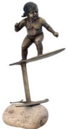
13 ЖУРАВЕЛЬ ВОЛОДИМИР (1986) «Малюк-серфер», 2021

граніт, бронза, h = 53 см Підпис, дата і тираж знизу на основі Тираж: 3/20