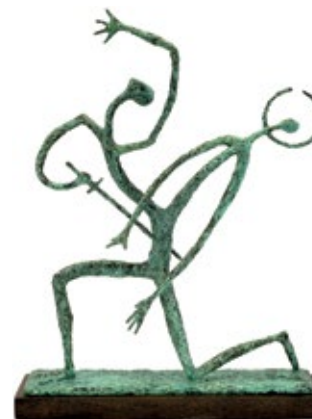
18 БАГАЛІКА ЮРІЙ (1958) «Каїн і Авель», 1992

бронза, дерево 56 x 43 x 12 см Підпис на основі Тираж: 1/6