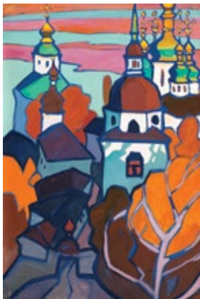
1 ХИМИЧ ЮРІЙ (1928–2003) «Видубичі», 1967