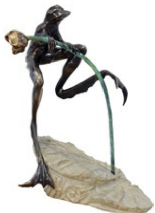
15 КАЛЬЧЕНКО МИКИТА (1954) «Жабка», 2022

бронза, мармуровий вапняк h = 36 см Підпис на лапці Тираж: 1/1