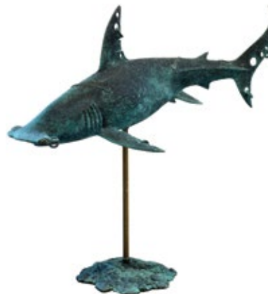
16 МИКИТЕНКО ВОЛОДИМИР (1970) «Акула-молот», 2020

мідь, бронза, H – 59 см Підпис і тираж збоку Тираж: 3/12