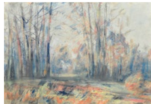
5 ШОВКУНЕНКО ОЛЕКСІЙ (1884–1974) «Лісовий пейзаж», 1970–і

папір, пастель 44 x 64 см Підпис знизу праворуч